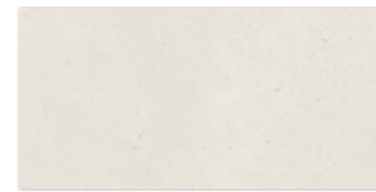
EFFECT GRYS 29,8×59,8 EFFECT GRYS 29,8×59,8