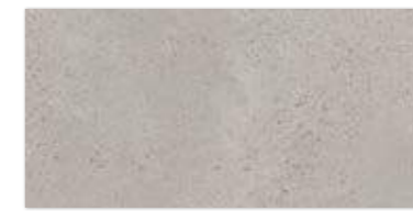
EFFECT GRAFIT 29,8×59,8 EFFECT GRAFIT 29,8×59,8