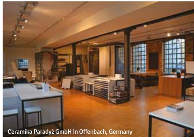
Ceramika Paradyż GmbH in Offenbach, Germany