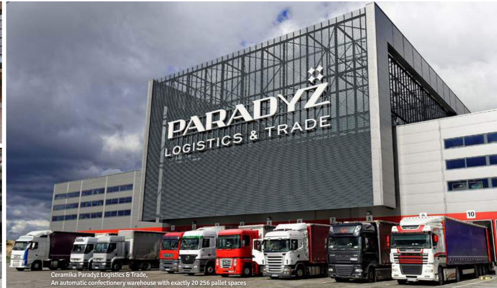
Ceramika Paradyż Logistics & Trade, An automatic confectionery warehouse with exactly 20 256 pallet spaces

Ceramika Paradyż gehört zu den führenden Herstellern in Polen und verfügt über insgesamt fünf Produktionsstätten und ein hochmodernes vollautomatisches Logistik-Zentrum mitten in Europa. Die Firma wurde bereits vor 31 Jahren gegründet. Heute befindet es sich in der zweiten Generation im Familienbesitz.