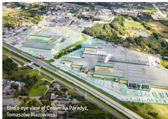
Bird's-eye view of Ceramika Paradyż, Tomaszów Mazowiecki