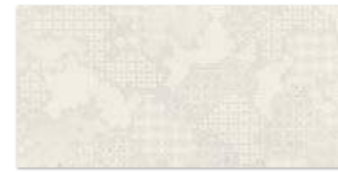
EFFECT GRYS PATCHWORK 29,8×59,8 EFFECT GRYS PATCHWORK 29,8×59,8