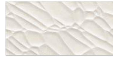
EFFECT GRYS 29,8×59,8 EFFECT GRYS 29,8×59,8