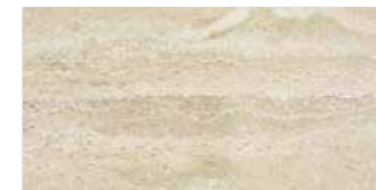
SUNLIGHT STONE BROWN 30×60 SUNLIGHT STONE BROWN 30×60