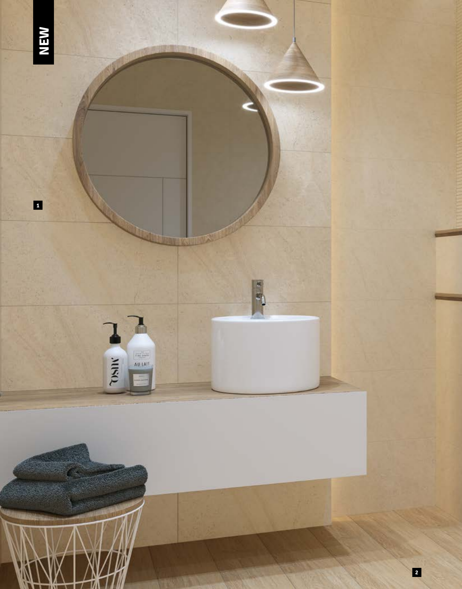
1 | SUNLIGHT SAND DARK CREMA MATT. 30×60 SUNLIGHT SAND DARK CREMA 30×60 MATT