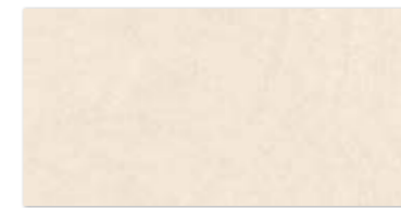
SUNLIGHT SAND CREMA 30×60 SUNLIGHT SAND CREMA 30×60

STONE BEIGE • STONE BROWN • SAND CREMA • SAND DARK CREMA 60×60 • 30×60 • 22×25,5