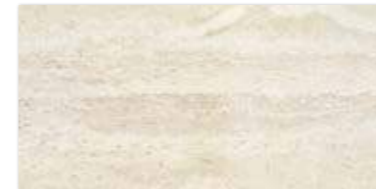
SUNLIGHT STONE BEIGE 30×60 SUNLIGHT STONE BEIGE 30×60

STONE BEIGE • STONE BROWN • SAND CREMA • SAND DARK CREMA 60×60 • 30×60 • 22×25,5