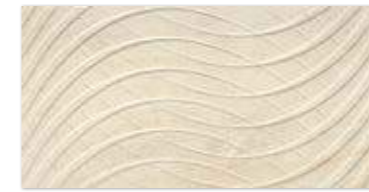
SUNLIGHT SAND DARK CREMA B 30×60 SUNLIGHT SAND DARK CREMA B 30×60