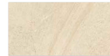
SUNLIGHT SAND DARK CREMA 30×60 SUNLIGHT SAND DARK CREMA 30×60