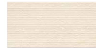
SUNLIGHT SAND CREMA A 30×60 SUNLIGHT SAND CREMA A 30×60